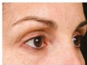
療程後 15 個月